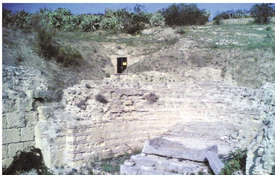
L'area archeologica della basilica e delle catacombe di Santa Sofia