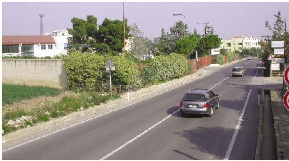
Una panoramica della zona di via Trani

A sorpresa è stata prevista nel nuovo Piano urbano edilizio di iniziativa pubblica