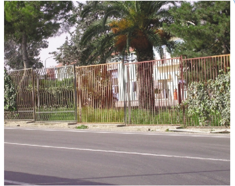
Andria, l'azienda che rischia la chiusura