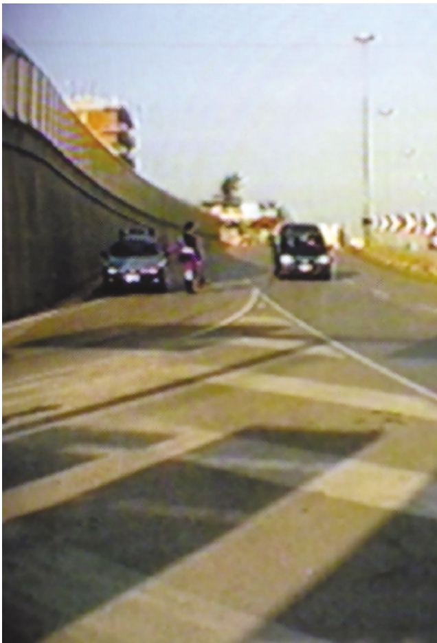
La curva della «231» in cui è avvenuto il tragico incidente

Un morto e tre feriti è il bilancio dell'ennesimo incidente stradale